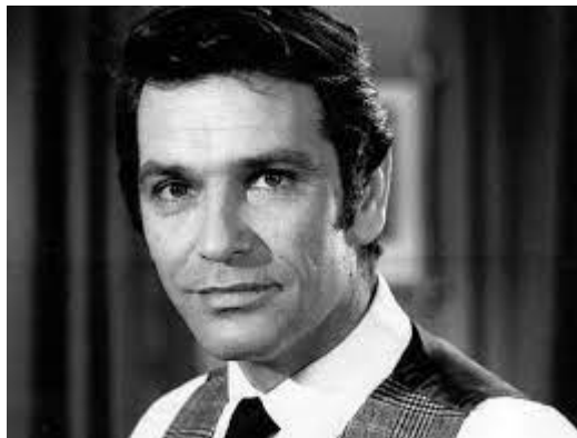
Νίκος Κούρκουλος, ηθοποιός (1934 – 2007)

αναδρομικών εκδηλώσεων που οργάνωσαν το Μουσείο Μοντέρνας Τέχνης της Νέας Υόρκης (1993) και το Κέντρο Ζορζ Πομπιντού στο Παρίσι (1995). Θεωρείται ένας από τους σημαντικότερους σκηνοθέτες της πρώτης μεταπολεμικής γενιάς.